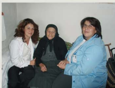
«η κοινωνική υποστήριξη στο σπίτι...»