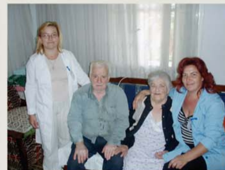
«η βοήθεια σε οικιακές εργασίες...»

Οι υπηρεσίες παρέχονται με περιοδικές επισκέψεις του προσωπικού στο σπίτι των εξυπηρετούμενων ανάλογα με τις ανάγκες και ιδιαιτερότητές τους.