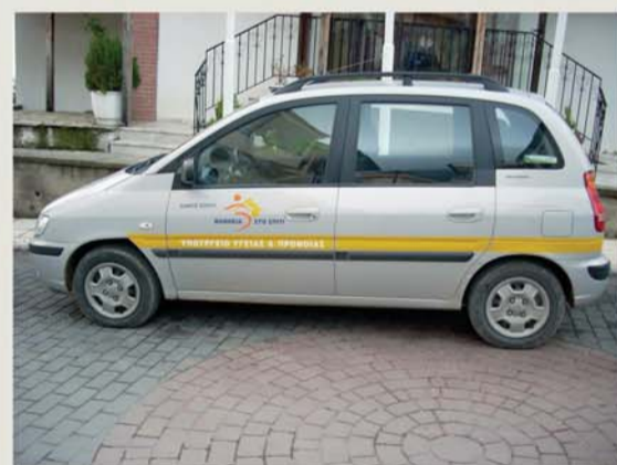
«η συνοδεία ατόμων με κινητικές δυσκολίες...»

Επίσης μέσω της συνεργασίας του προγράμματος με τους αρμόδιους φορείς και τις άλλες υπηρεσίες υγείας και πρόνοιας γίνεται προσπάθεια για καλύτερη ποιότητα παροχής υπηρεσιών στους πολίτες.