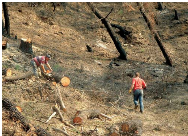
Φωτογραφίες από τη δράση των μελών του Δασικού Συνεταιρισμού Σοχού και Κρουονερίου στην Αρχαία Ολυμπία

Την συγκεκριμένη τοποθεσία επισκέφτηκε ο Πρωθυπουργός κ. Κ.Καραμανλής και σε συνομιλία του με τα μέλη του συνεταιρισμού μας, τους