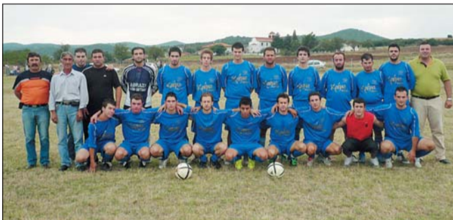
Β' ΕΡΑΣΙΤΕΧΝΙΚΗ - 6ος ΟΜΙΛΟΣ