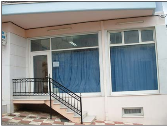
Οι εγκαταστάσεις του Δημοτικού Φυσιοθεραπευτηρίου στο Σοχό

Οι υπηρεσίες παρέχονται μόνο με παραπεμπτικό ιατρού όμορης ειδικότητας.