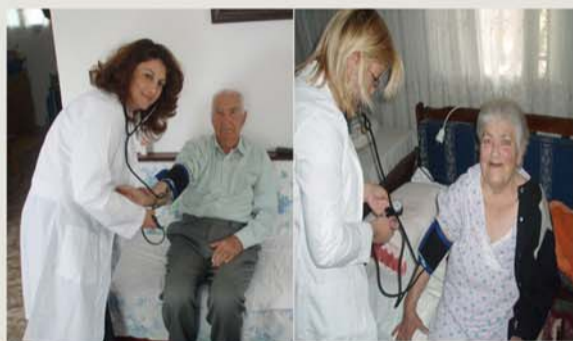
«Η παροχή νοσηλευτικών υπηρεσιών...»

Καλύπτεται έτσι το σύνολο των αναγκών σε θέματα κοινωνικής φροντίδας, κατ'οίκον νοσηλείας και υποστήριξης σε οικιακές εργασίες.