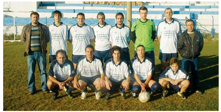
Α' ΕΡΑΣΙΤΕΧΝΙΚΗ - 2ος ΟΜΙΛΟΣ

Η ομάδα της Αυγής δεν έχει κάνει το καλύτερο δυνατό ξεκίνημα φέτος στο πρωτάθλημα, δείχνοντας ιδιαίτερη δυσκολία στο να κερδίζει βαθμούς στα εκτός έδρας παιχνίδια. Στα τελευταία παιχνίδια η ομάδα δείχνει να ανακάμπτει και να βρίσκει πιο εύκολα το δρόμο προς τα δίχτυα με αποκορύφωμα τον αγώνα μεταξύ του Ιάσων και του Κεραυνού Αγίου Παύλου όπου η ομάδα νίκησε με 6-2!