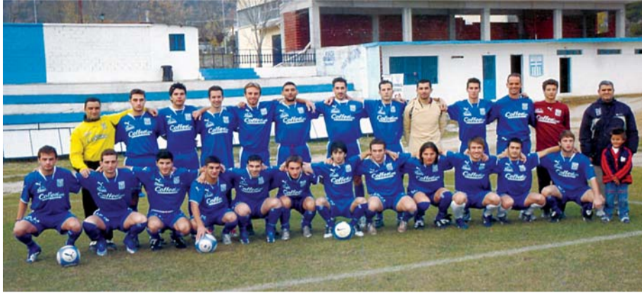
Δ' ΕΘΝΙΚΗ - 2ος ΟΜΙΛΟΣ

Ξεκίνησαν οι υποχρεώσεις της φετινής σεζόν για τον Εθνικό Σοχού στην Δ' Εθνική μετά την επιτυχημένη άνοδο πέρυσι. Ανταγωνιστικός, και δύσκολος αντίπαλος για οποιαδήποτε ομάδα, σε μια κατηγορία με ιστορικούς συλλόγους. Ο Εθνικός Σοχού στέκεται άξια προς το παρόν και όλα δείχνουν ότι και φέτος θα φέρει περηφάνια και χαρά στους οπαδούς του αλλά θα κερδίσει και τον σεβασμό των αντιπάλων του.