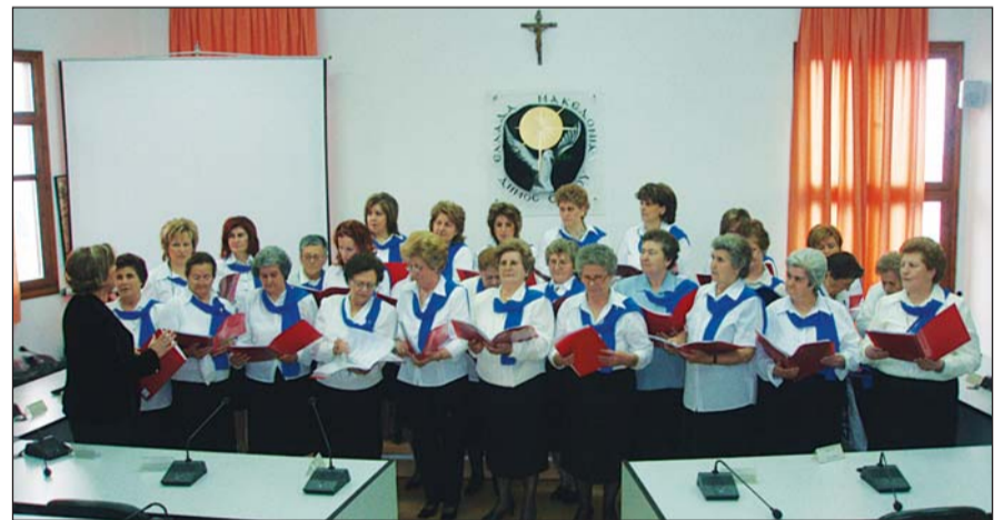
Το τμήμα της χορωδίας των μελών του Κ.Α.Π.Η Σοχού

Στις 11 Δεκεμβρίου το τμήμα της χορωδίας και του χορευτικού των μελών του ΚΑΠΗ Σοχού και ύστερα από πρόσκληση του αντίστοιχου του Δήμου Μετεώρων Πολίχνης, παρουσίασε το καλλιτεχνικό του πρόγραμμα με τραγούδια και χορούς.