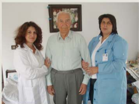
«είμαστε κοντά στο δημότη που μας χρειάζεται»

Σκοπός του προγράμματος είναι η παραμονή των ηλικιωμένων και των ατόμων με αναπηρίες στο οικείο φυσικό και κοινωνικό τους περιβάλλον, η διατήρηση της συνοχής της οικογένειά τους, η αποφυγή χρήσης ιδρυματικής φροντίδας ή καταστάσεων κοινωνικού αποκλεισμού, η εξασφάλιση αξιοπρεπούς και υγιούς διαβίωσης και η βελτίωση της ποιότητας ζωής τους.