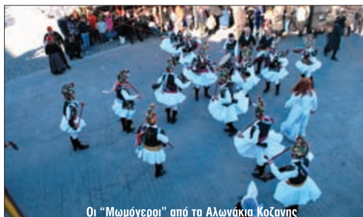
Οι "Μωμόγεροι" από τα Αλωνάκια Κοζάνης