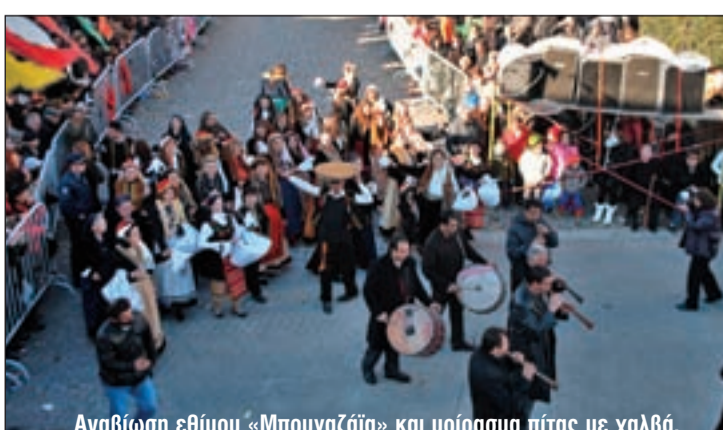
Αναβίωση εθίμου «Μπουγαζάια» και μοίρασμα πίτας με χαλβά.