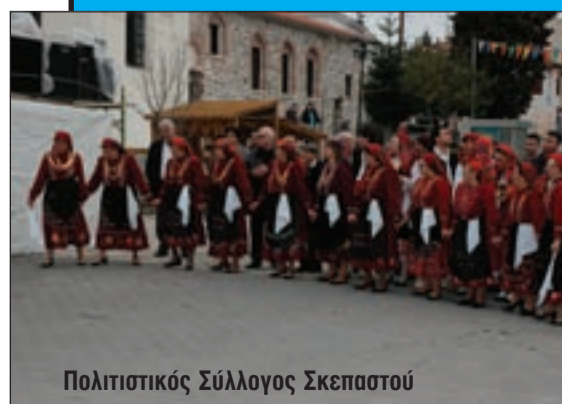
Πολιτιστικός Σύλλογος Σκεπαστού